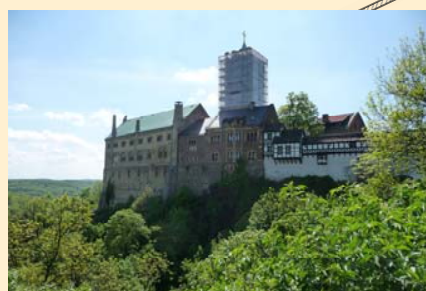
Eisenach - le château de la Wartburg, haut-lieu de la Réforme luthérienne.