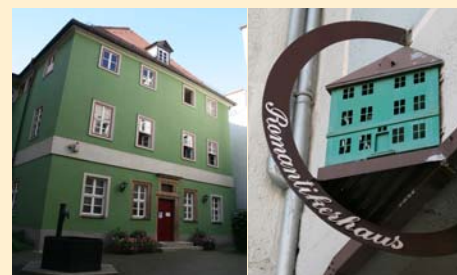
Jena - Maison du romantisme