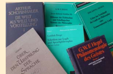
Jena - philosophie allemande