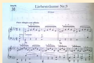
Weimar - Franz Liszt