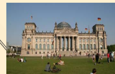
Berlin - capitale de l'Allemagne