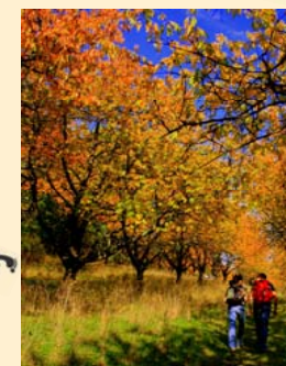
La forêt de Thuringe - toujours une bonne adresse pour les randonneurs !