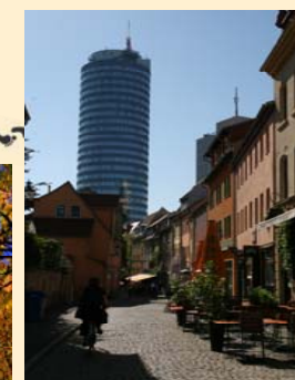
Jena - « Wagnergasse », cafés, détente, ambiance