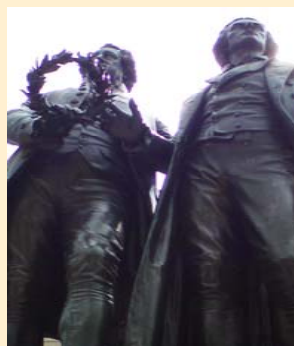
Weimar - ville de Goethe et Schiller